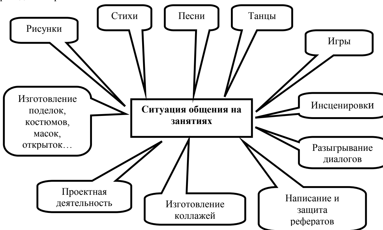
Рис 2. Использование различных приемов на занятиях

Использование различных приёмов на занятиях при обучении иностранному языку приведено на рис. 2: